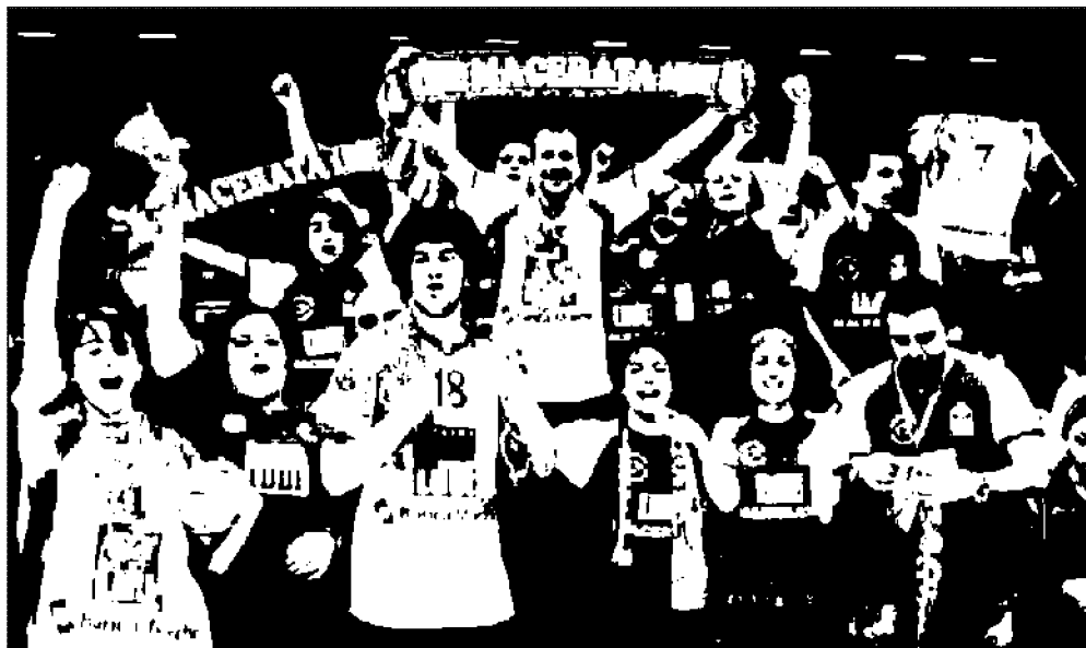
I tifosi della Lube Banca Marche, dopo l'eliminazione in Coppa Italia a Modena, sperano di gioire in campionato