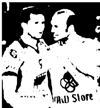
Vermiglio e Corsano